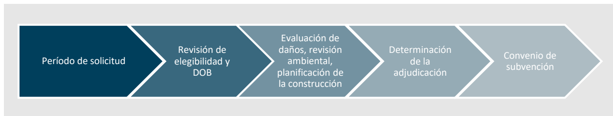
FIGURA 1: PASOS DE LA SOLICITUD INICIAL Y LA DOCUMENTACIÓN

El proceso incluye que los propietarios de viviendas completen el periodo de solicitud presentando la documentación inicial de elegibilidad que se requiere para avanzar a la concesión de beneficios a los propietarios de viviendas elegibles. Después de la revisión de la elegibilidad y la duplicación de beneficios (DOB), el resultado de la fase inicial de documentación de elegibilidad es el avance a la fase de evaluación, donde el personal del programa llevará a cabo una evaluación de los daños, la revisión del medio ambiente, y desarrollar el costo estimado de reparación (ECR) para las reparaciones o reemplazo. El ECR se utiliza entonces para desarrollar la Determinación de Adjudicación (reparación, reconstrucción o sustitución), a la que sigue la firma de un acuerdo de subvención.