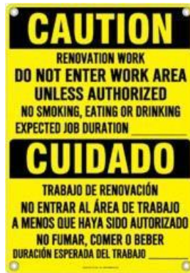
EJEMPLO DE SEÑALIZACIÓN