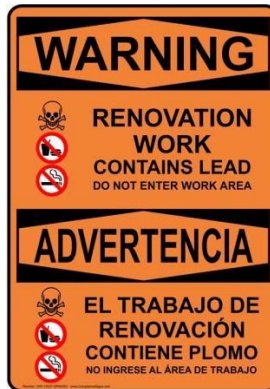
6. EJEMPLO DE SEÑALIZACIÓN

Si las condiciones de la obra no son conformes, se emitirá una orden de paralización de las obras hasta que se resuelvan todos los problemas y sean verificados por el personal del programa. El tiempo en que el proyecto esté detenido se incluirá en el cálculo de la duración de la construcción y se considerará culpa del contratista y estará sujeto a penalizaciones por rendimiento. La emisión de una orden de paralización de las obras también se tendrá en cuenta a la hora de determinar las futuras asignaciones y la participación en futuros proyectos.